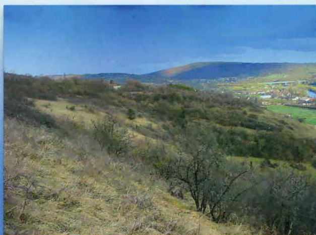
Vue de la partie nord de la Côte de Moini

Propriété : Commune de Quingey Gestionnaire du site : association T.R.I Surface : 20 ha Intérêt patrimonial : pelouses calcaires du Festuco – Brometea (annexe I directive « Habitats ») et fruticées thermophiles Espèces remarquables : Orobanche de Bartlingi ( Orobanche bartlingii ), Bacchante ( Lopinga achine ), Grand Nègre des bois ( Minois dryas ), Lézard vert ( Lacerta bilineata ) Statuts : - Site Natura 2000 « Vallée de la Loue » - Espace Naturel Sensible du département du Doubs - ZNIEFF de type I « Pelouses de la Côte de Moini »