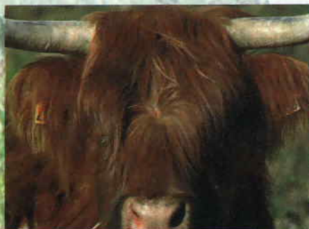
Vache écossaise Highland Cattle