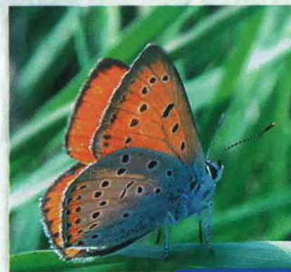
Cuivré des marais

Les animaux qui appartiennent à un éleveur de Breurey-lès-Faverney en Haute-Saône seront suivis localement, pendant 5 ans, par un agriculteur d'Ornans.