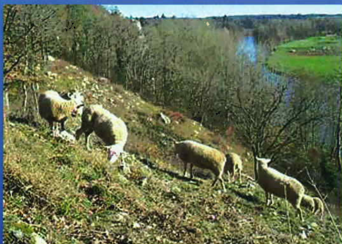
La mise en place d'un pâturage à l'aide de chèvres et de moutons devrait permettre de stopper l'enfrichement du site

Le Conseil Général du Doubs apportera également son soutien financier pour les suivis faune et flore et pour les aménagements destinés à l'accueil du public et des scolaires.