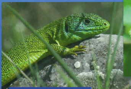
Lézard vert

Contexte : autrefois pâturée par des chèvres, la Côte de Moini est aujourd'hui abandonnée par l'agriculture et s'enfriche progressivement. Cette fermeture du paysage s'accompagne également d'une perte de biodiversité puisque les pelouses calcaires et les espèces associées thermophiles (qui aiment la chaleur) sont remplacées progressivement par des espèces forestières plus banales. Les documents de gestion (document d'objectifs Natura 2000 et plan de gestion Espaces Naturels Sensibles) préconisent la remise en place d'un pâturage extensif sur la Côte de Moini afin de stopper l'enfrichement.