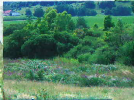
Ornans - Zone humide des "Vouasses"