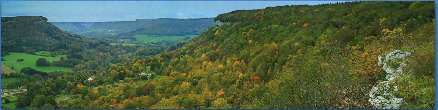
Ornans – Vallée de la Loue