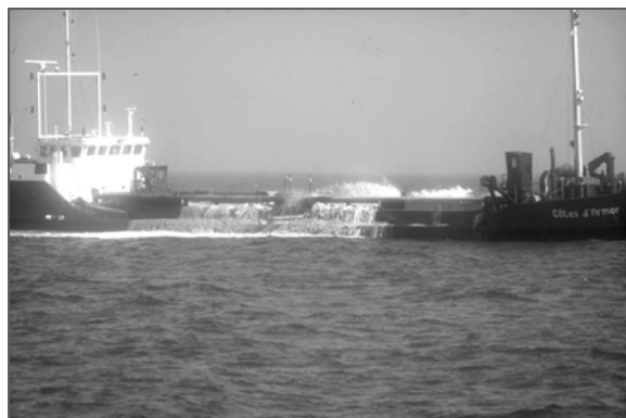
Drague aspiratrice de maerl sur le banc de St Nicolas des Glenan

L'eutrophisation entraîne également une sédimentation accrue sur les bancs qui finissent par disparaître sous la vase ou sous les algues opportunistes. Les anoxies ou hypoxies passagères qui en découlent font disparaître un grand nombre d'espèces qui sont remplacées par des espèces opportunistes monopolisant les ressources. L'eutrophisation peut être due soit aux effluents urbains