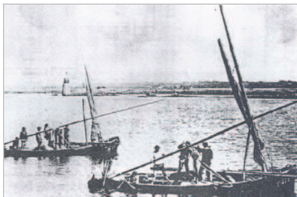
Récolte du maerl en Bretagne au début du XXe siècle

L'extraction a deux principaux effets : (1) celui de faire disparaître littéralement le banc sur la zone extraite et (2) de provoquer un nuage de turbidité autour de la zone, qui va amener la disparition du maerl sous une couche de sédiments fins, interdisant par là l'activité photosynthétique et provoquant de fortes baisses de biodiversité. En règle générale la quantité extraite excède de très loin le renouvellement de la ressource, l'activité n'étant pas durable. Les bancs des Glenan, de Lost Pic, du Phare de la Croix et des Pourceaux sont concernés par ces activités). Plusieurs bancs ont disparu dans les années 1970-1980 du fait de l'extraction (baies de St Malo et de St Brieuc).